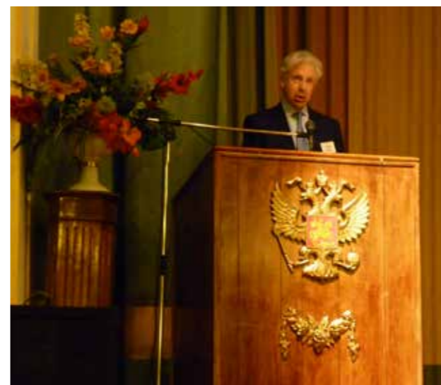
Выступление вице-президента ФПА Г.М. Резника

Наиболее значимое событие съезда – принятие изменений и дополнений в Кодекс профессиональной этики адвоката. Отмечу, что Федеральная палата проделала по этому вопросу колоссальную работу в сравнительно небольшой промежуток времени. Всего